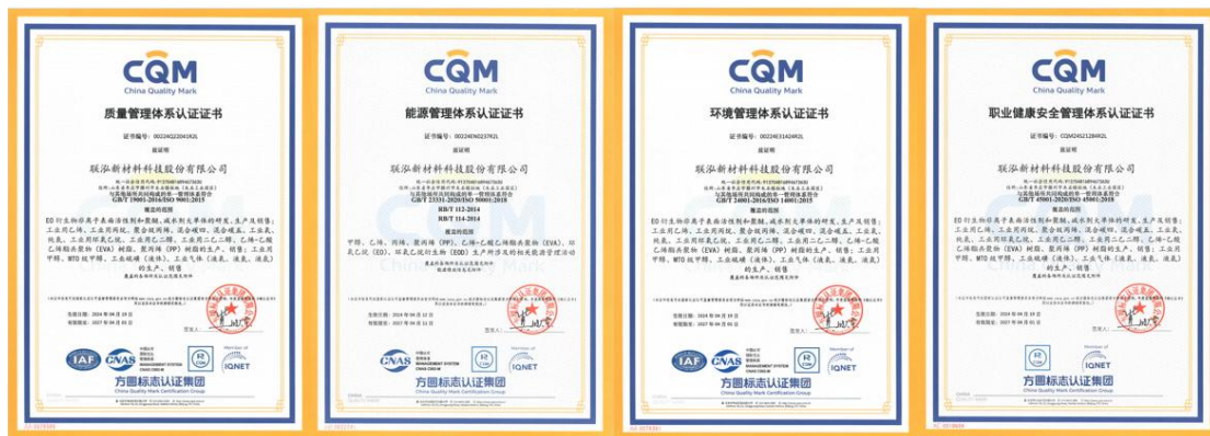
公司一体化管理体系认证证书

2017年3月，公司按照 GB/T 19001-2016、GB/T 23331-2012、GB/T 24001-2016、GB/T 28001-2011 标准建立了质量、能源、环境、职业健康安全一体化管理体系，并于 2018 年 4 月通过了 GB/T 19001-2016、GB/T 23331-2012、GB/T 24001-2016、GB/T 28001-2011 认证，获得了质量管理体系、能源管理体系、环境管理体系、职业健康安全管理体系认证证书。ISO45001:2018、ISO50001:2018 标准发布实施后，公司及时进行了标准转版工作。2024 年 3 月，方圆认证公司对我公司一体化管理体系进行了再认证，并已颁发质量、环境、职业健康安全、能源 4 个管理体系的认证证书。